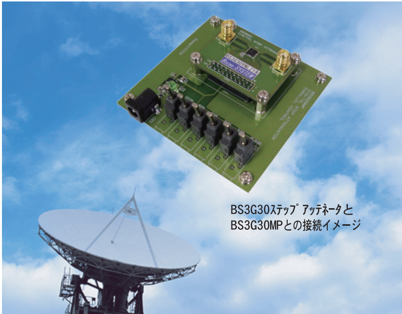
BS3G30ステップアッテネータと BS3G30MPとの接続イメージ

BS3G30デジタルステップアッテネータを 6ビット・パラレルで制御する基板です。