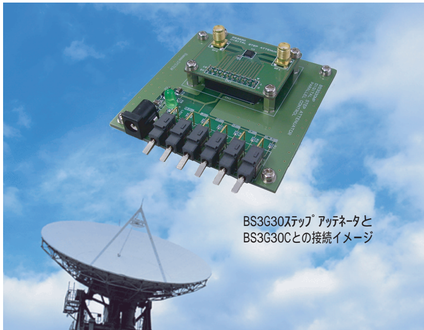
BS3G30ステップ アッテネータと BS3G30Cとの接続イメージ

BS3G30デジタルステップアッテネータを 6ビット・パラレルで制御する基板です。