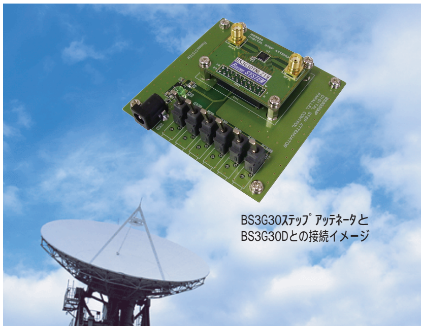
BS3G30ステップ アッテネータと BS3G30Dとの接続イメージ

BS3G30デジタルステップアッテネータを 6ビット・パラレルで制御する基板です。